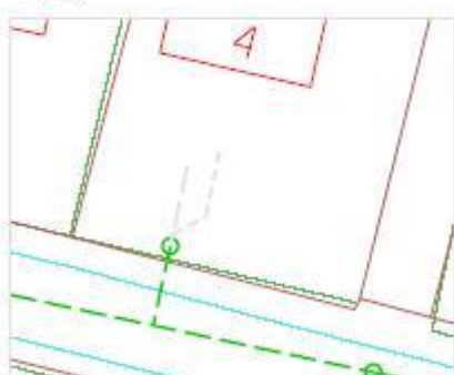
Tilslutningsprincip med spildevand- og regnvand til fællesskelbrønd hvor bebyggelse ikke er I skel