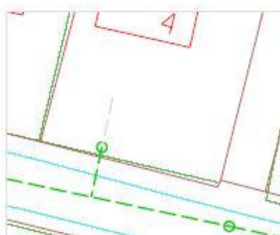
Tilslutningsprincip med fællesskelbrønd hvor bebyggelse ikke er I skel