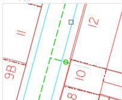
Tilslutningsprincip med fællesskelbrønd hvor bebyggelse er I skel