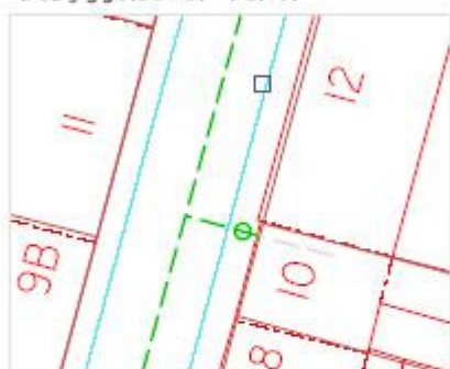
Tilslutningsprincip med fællesskelbrønd hvor bebyggelse er i skel