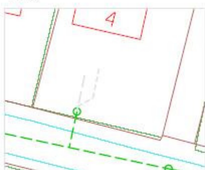
Tilslutningsprincip med spildevand og regnvand til fællesskelbrønd hvor bebyggelse ikke er i skel