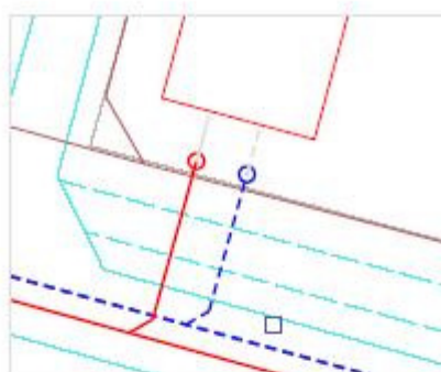
Tilslutningsprincip med spildevand og regnvandsskelbrønd hvor bebyggelse ikke er i skel