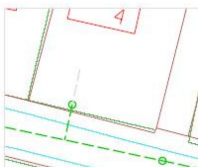
Tilslutningsprincip med fællesskelbrønd hvor bebyggelse ikke er i skel