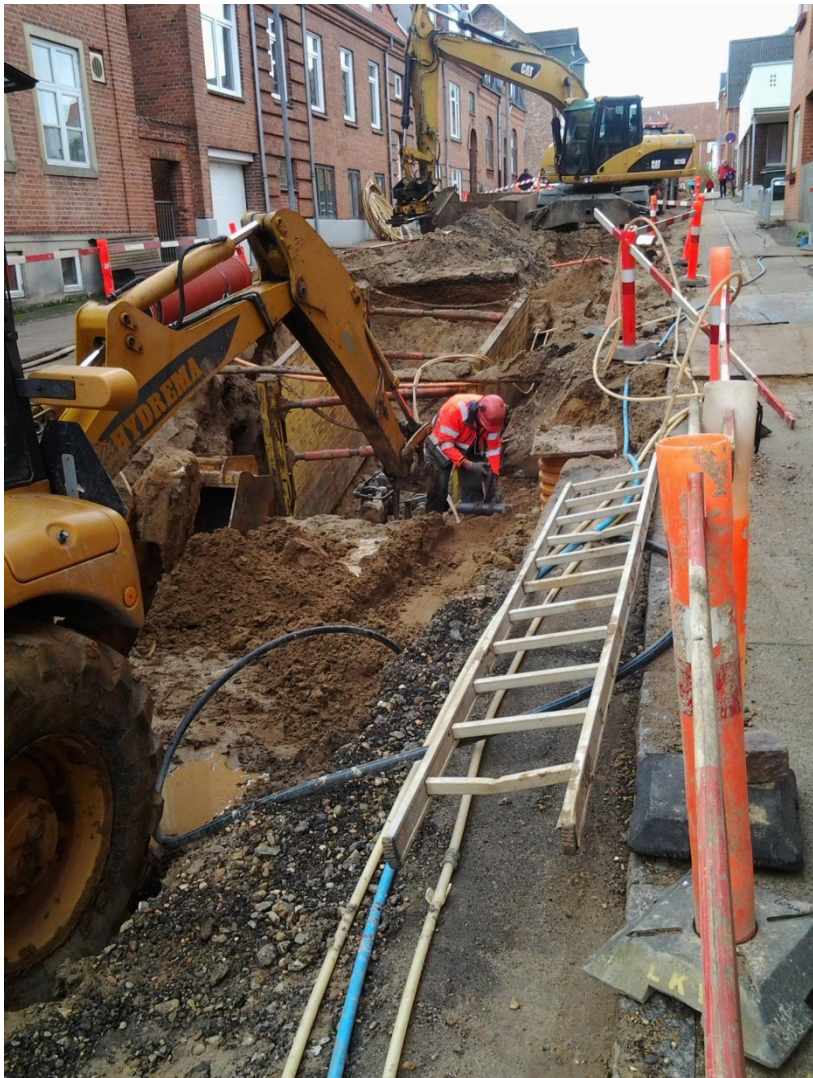
Sallinggade i Skive. Kloakarbejde i gang.

Skaden på bassinet i Balling er blevet udbedret, efter der er indgået forlig mellem partnerne om reparationsomfang og reparationsmetoder. Bassinet er nu monteret med automatisk skyllesystem og idriftsat.