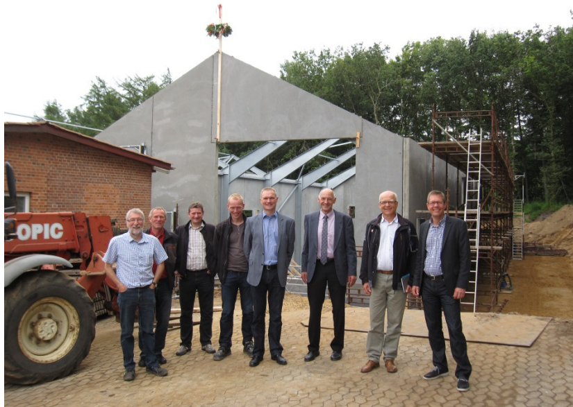
Rejsegilde på nyt vandværk i juli 2013