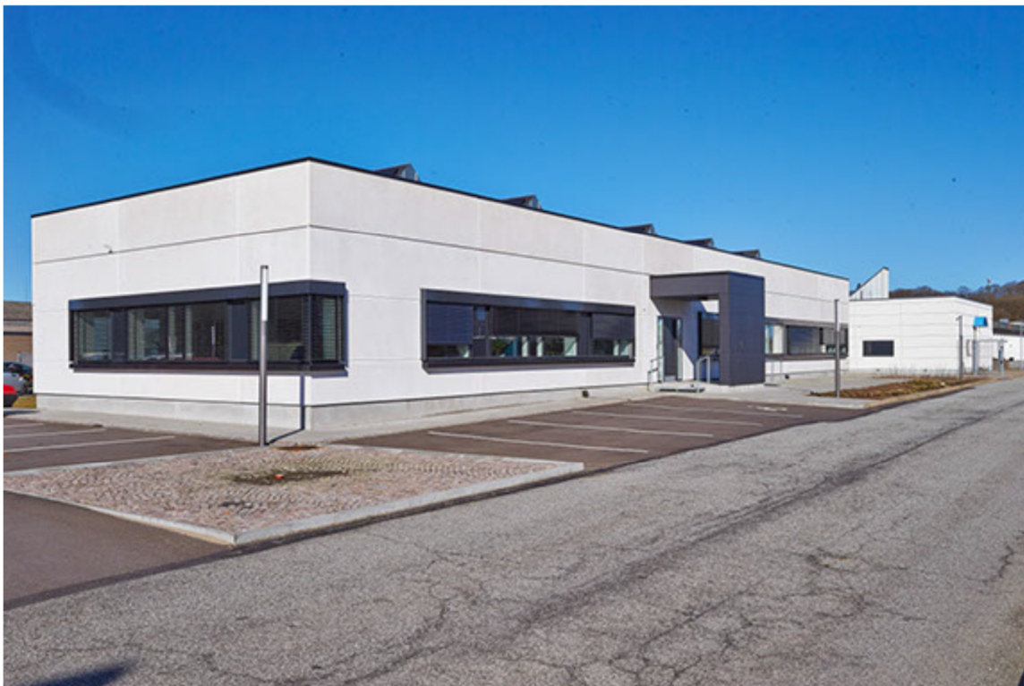
Den nye administrationsbygning på Norgesvej 5 i Skive er en tilbygning til eksisterende kontorbygning.

Omkring bygningen er der etableret 4 forskellige typer LAR anlæg - Lokal Afledning af Regnvand - således at regnvand fra bygningen og parkeringsarealer nedsives på grunden i særlige opbyggede og tilplantede områder. Med de 4 typer LAR-anlæg vil vi gerne vise husejere, hvordan de kan nedsive regnvandet på egen grund, og hvilken beplantning der kan anvendes fremfor at lede regnvandet til kloakken. Hvor det er muligt at foretage nedsivning af regnvandet, er det at foretrække, da det er til gavn for grundvandet og naturen.