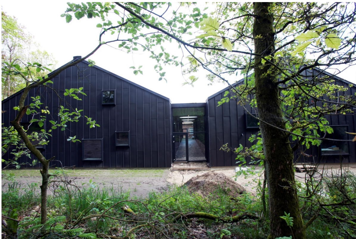
Det nye Skive vandværk.