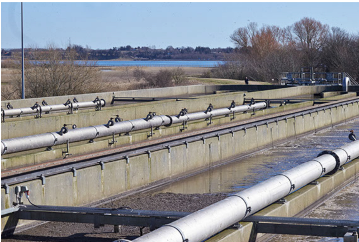
Skive renseanlæg. Procestanken med Skive Fjord i baggrunden.