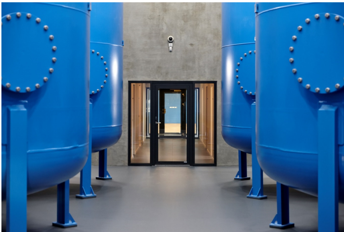
Filterbeholdere på det nye Skive Vandværk på Jegstrupvej.

Byggeriet af det nye vandværk i Skive er afsluttet i 2014. Siden august måned 2014 har det nye vandværk leveret rent drikkevand til forbrugere. Det nye vandværk fremstår som et moderne og fremtidssikret anlæg, og er model for en række af de nye vandværker, der er under bygning i Danmark. Vandværket er bygget som en levnedsmiddelvirksomhed, med stor fokus på hygiejne og forsyningsikkerhed.