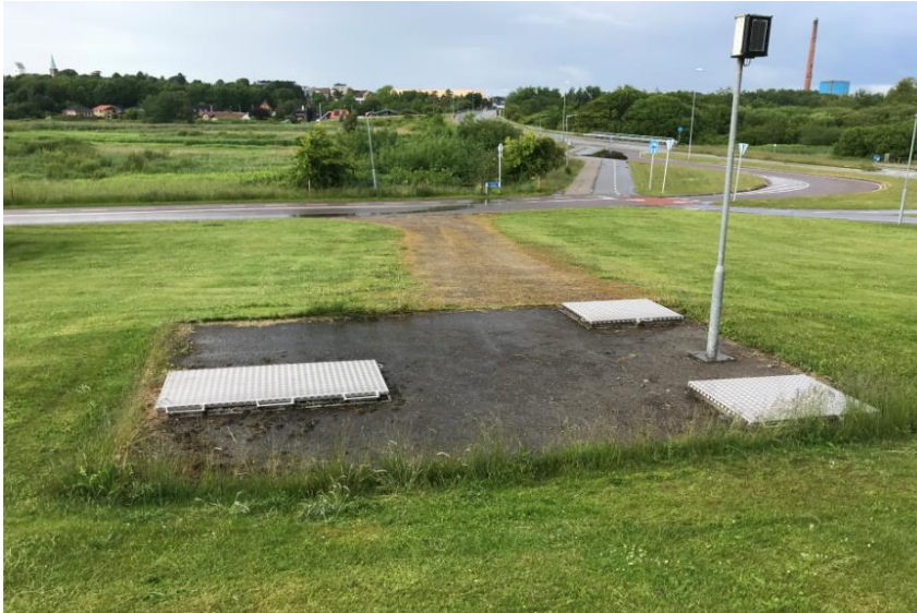
Overløbsbygværk ved Sdr. Boulevard i Skive. Bygværket er en indbygget "sikkerhedsventil" i kloaknettet som anvendes ved kraftig regn.

Det blev ligeledes oplyst, at processen med at fjerne overløbene er en fælles prioriteringsopgave for Skive Kommune og Skive Vand. Viden og kompetencer fra begge parter skal anvendes for at få prioriteret de projekter, der samlet giver mest miljø for pengene. Begge parter har tillid til, at vi i fællesskab får prioriteret de løsninger der er bedst for borgerne.