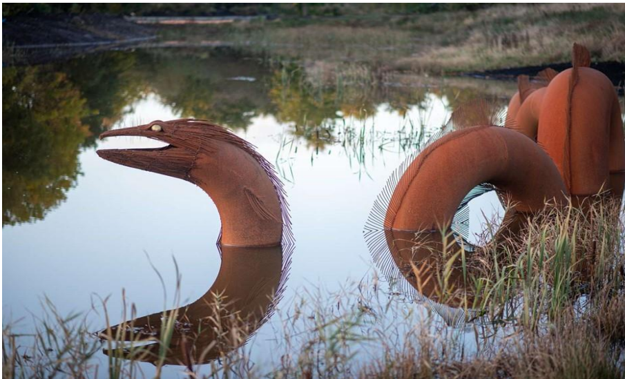
Ålekongen i det nordligste af de 3 regnvandsbassiner ved Glattrup bæk.

Arbejdet med færdiggørelse af projektet har været udfordret af store mængder regn i anlægsperioden og færdiggørelse af separering på kasernen. Der er få udeståender inden projektet er helt afsluttet. Som fin udsmykning har Ålekongen nu fået hjemsted i det nordlige regnvandsbassin.