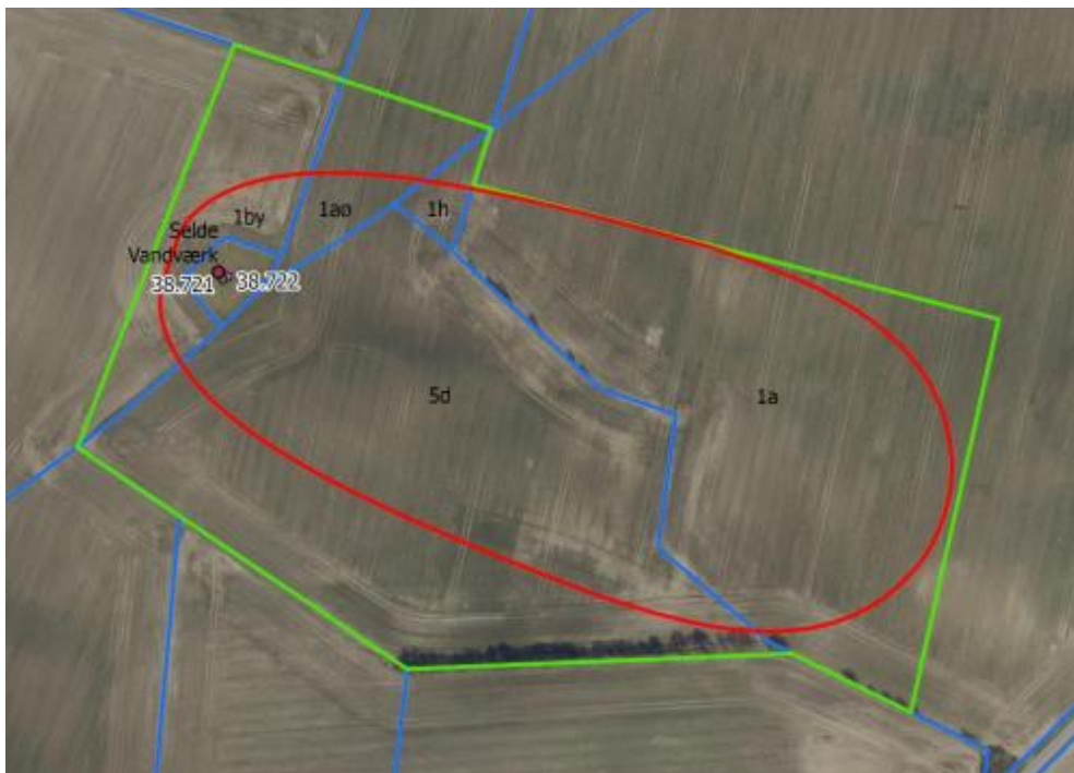
Boring tilhørende Selde vandværk. Rød streg markerer BNBO området. Grøn streg markerer forslag til område med dyrkningsrestriktioner. Blå streg er skel.

For at beskytte drikkevandet besluttede Folketinget i januar 2019 at kommunerne inden udgangen af 2022 skal have foretaget vurdering af behovet for indsatser og gennemført disse ved hver enkelt drikkevandsboring. Beskyttelsen kan for eksempel ske ved indgåelse af dyrkningsrestriktioner mod økonomisk kompensation til lodsejeren eller opkøb af jorden. Omkostningerne til beskyttelsen skal afholdes af den enkelte vandforsyning.